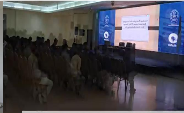
Sosialisasi Pencegahan dan Penanganan Kekerasan Seksual Baik Mahasiswa di Astama Politeknik Neeri Batam