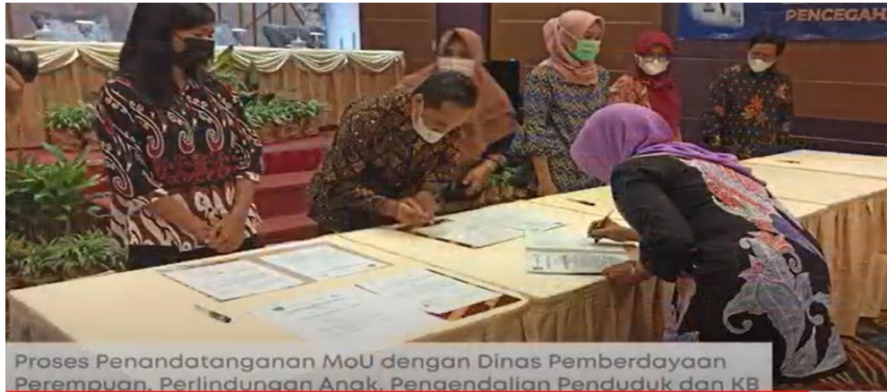
Proses Penandatanganan MoU dengan Dinas Pemberdayaan Perempuan, Perlindungan Anak, Pengendalian Penduduk dan KB