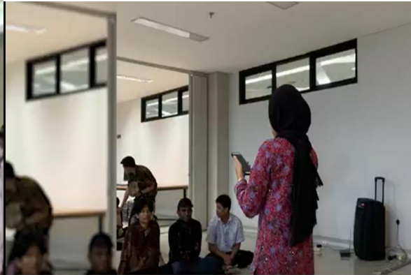
Sosialisasi Pencegahan dan Penanganan Kekerasan Seksual Baik Badan Eksekutif Mahasiswa Politeknik Neeri Batam