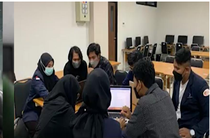
Kolaborasi PBL Matakuliah MKU Pancasila, Kewarganegaraan, Bahasa Indonesia, Agama, dan Matakuliah Sumberdaya Manusia